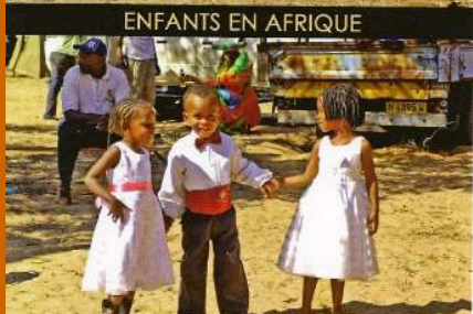
Fotoausstellung in Paris