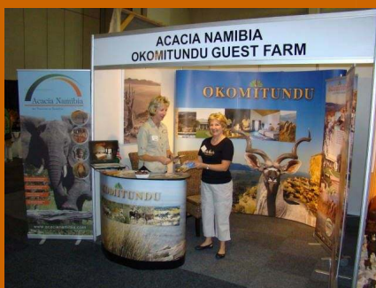
Bei der Destinations Expo