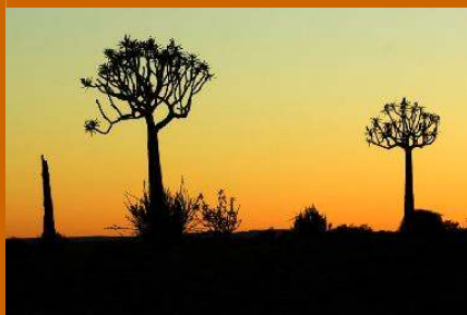
Köcherbäume im Gondwana Naturreservat