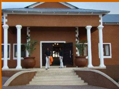
River Crossing Lodge