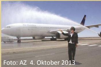
4. Oktober 2013