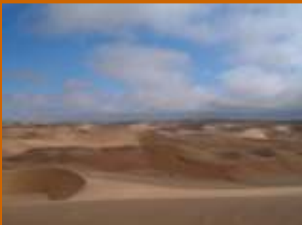
Dünen im Sperrgebiet Nationalpark