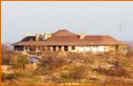
Etosha Safari Lodge

acacia@iway.na www.acacianamibia.com Windhoek Namibia Tel: +264 61 229142 Fax: +264 61 229125