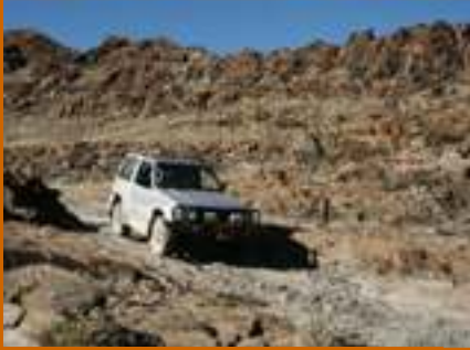
Fahrtraining im rauhen Terrain

Wussten Sie dass es im Sperrgebiet ein 'Brown Hye na Research Projekt' gibt ?