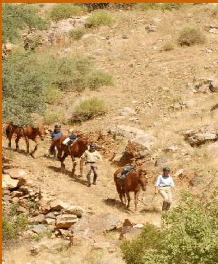
Wanderritt im Naukluftgebirge

acacia@iway.na www.acacianamibia.com Windhoek Namibia Tel: +264 61 229142 Fax: +264 61 229125