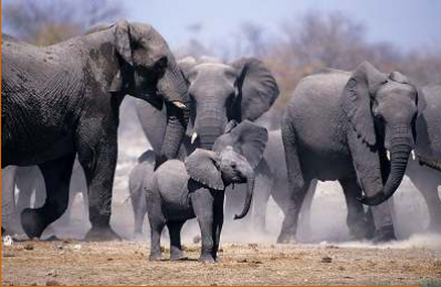
Elefanten beim Wasserloch