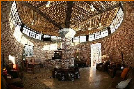
Taleni Etosha Village