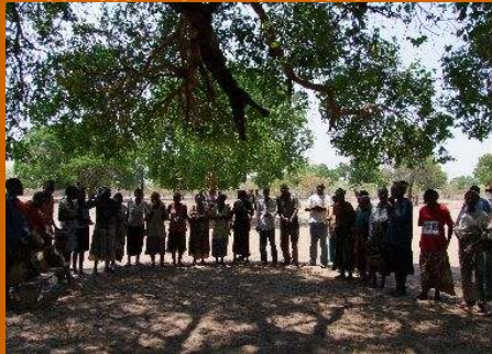
Mbukushu Village im Caprivi