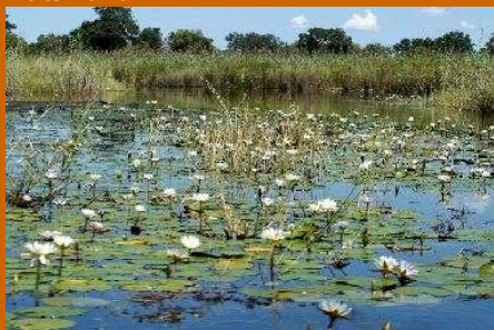
Einsame Okavango Wasserwege